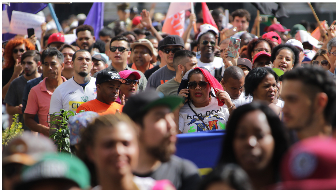
Marcha del domingo organizada por la Coordinadora Nacional de Inmigrantes.